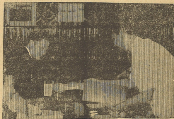
Em estudos a criação da Escola Média de Direito

Na sua intervenção o camarada Presidente Luiz Cabral realçou igualmente a dedicação e honestidade com que os membros do antigo Conselho dos Comissários exerceram as suas funções num período particularmente difícil da vida do nosso país, gravemente atingido pela seca.