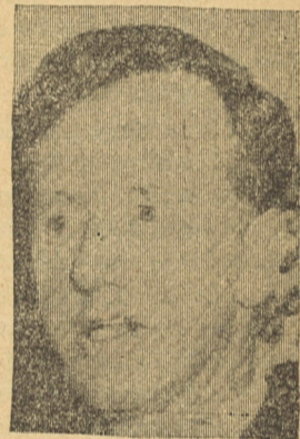
A história do encontro N'Komo-Smith