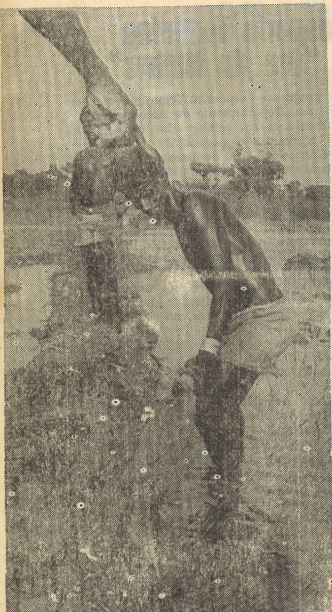
O apoio directo e sistemático ao camponês tem sido uma constante da política do DEPA e cujos resultados são já palpáveis

ção, e prevê o lançamento de mais 20 tabancas, com o apoio às hortas comunais e familiares aos pomares.