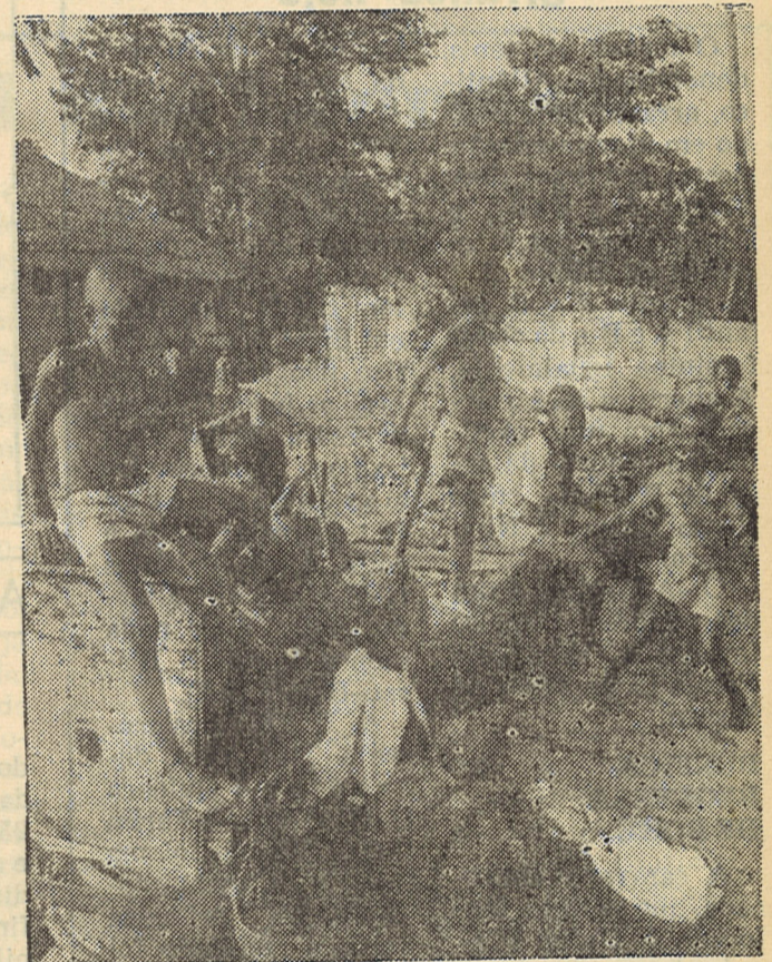
A subnutrição e a falta de assistência médica contribuem para a mortalidade infantil no Terceiro Mundo

«Em metade dos casos — sublinha Grant — a subalimentação não é causada pela falta de alimentos, mas por parasitas intestinais, febre e infecções».